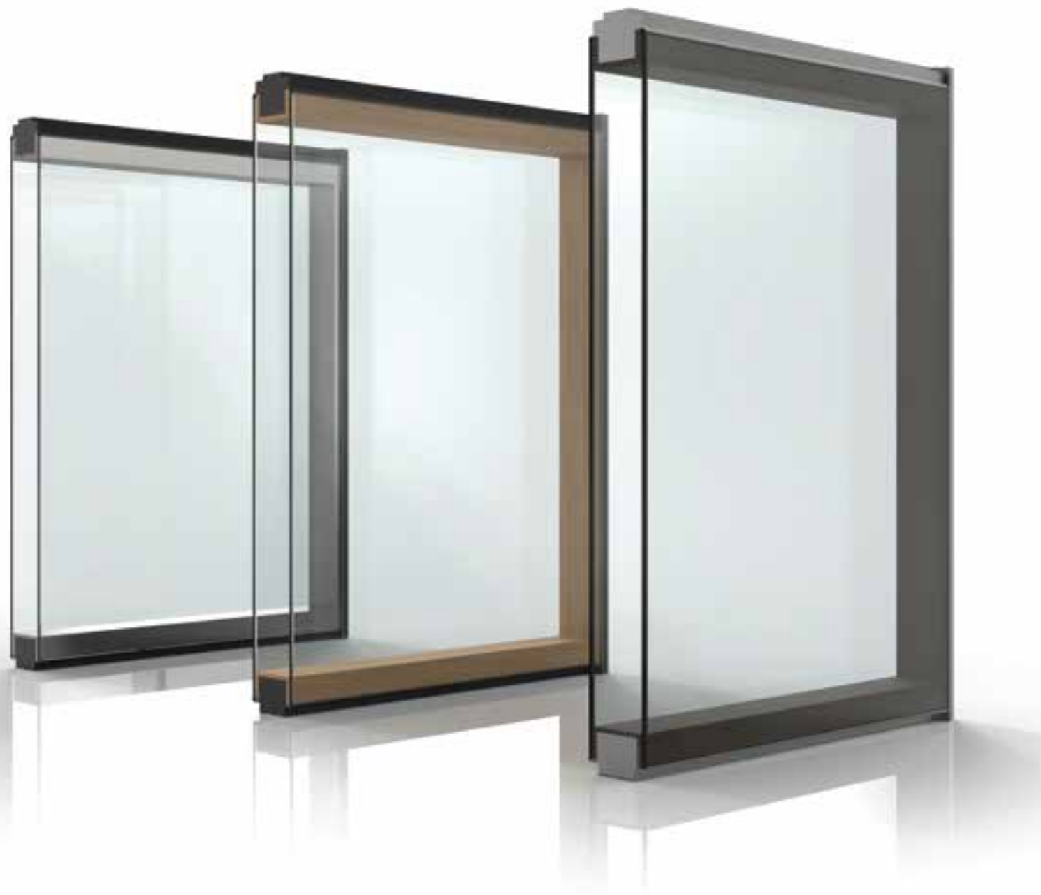
Divisória Duplo vidro panorâmico com interior em cromado;