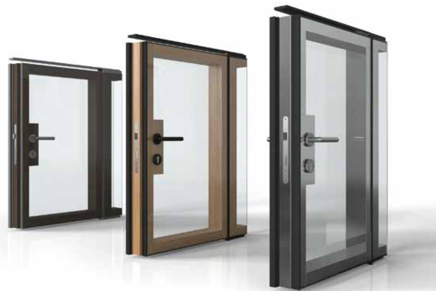
Porta em Duplo vidro panorâmico com interior em madeira de nogueira