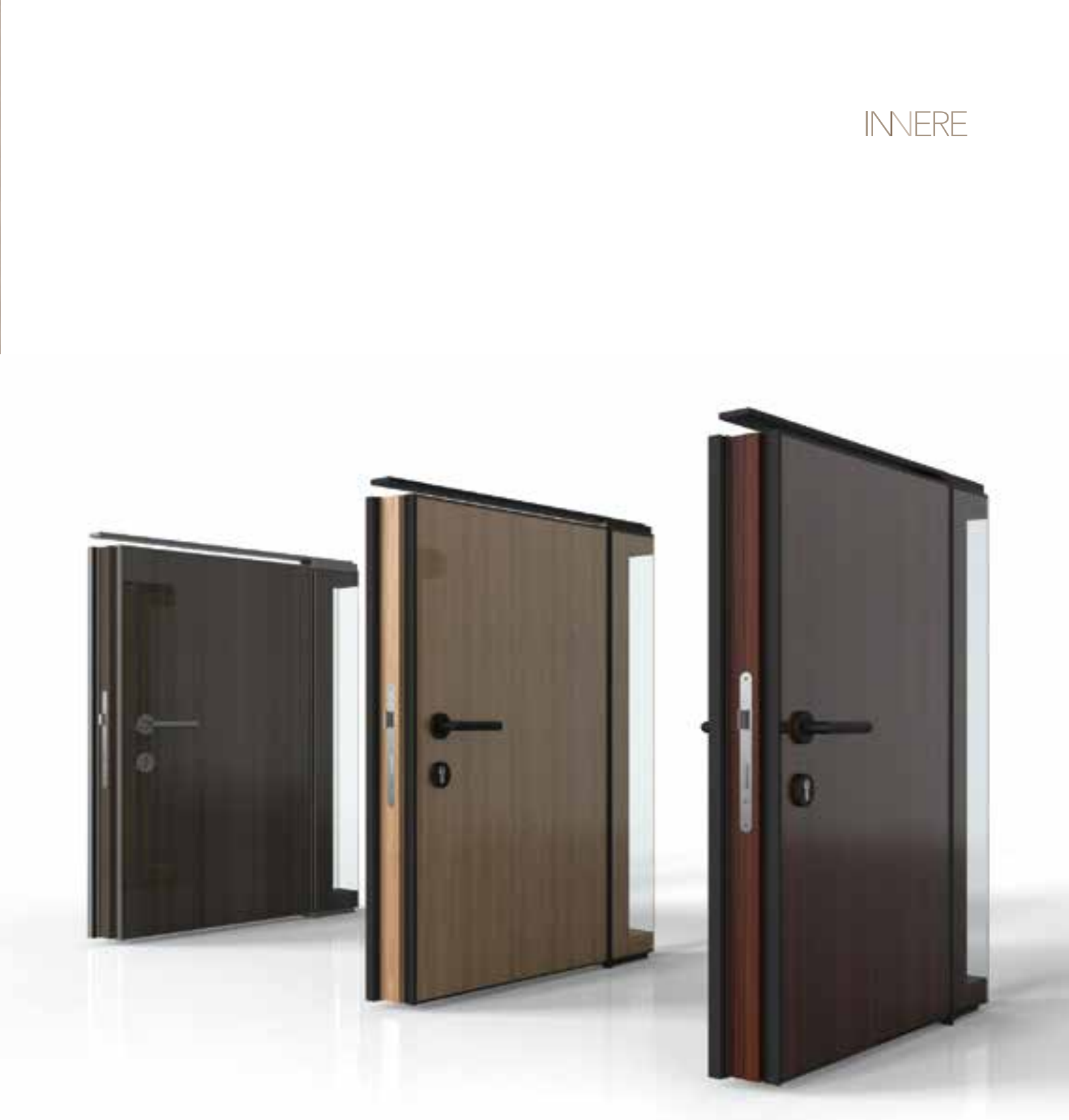
Porta opaca em madeira de nogueira